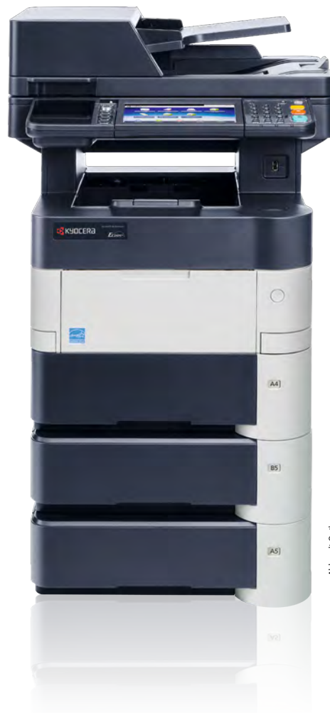
Abb. mit Optionen